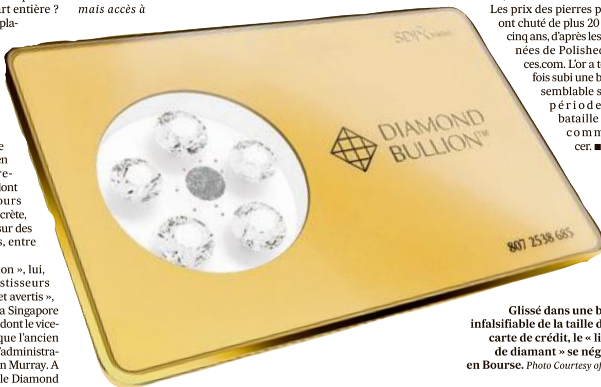
Glissé dans une boîte infalsifiable de la taille d'une carte de crédit, le « lingot de diamant » se négocie en Bourse.

Les prix des pierres polies ont chuté de plus 20 % en cinq ans, d'après les données de PolishedPrices.com. L'or a toutefois subi une baisse semblable sur la période. La bataille peut commencer. ■